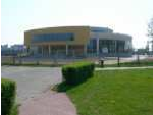
Centrum Wykładowo – Dydaktyczne PWSZ w Koninie