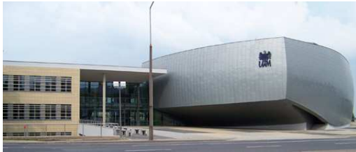
Wydział Pedagogiczno-Artystyczny UAM w Kaliszu